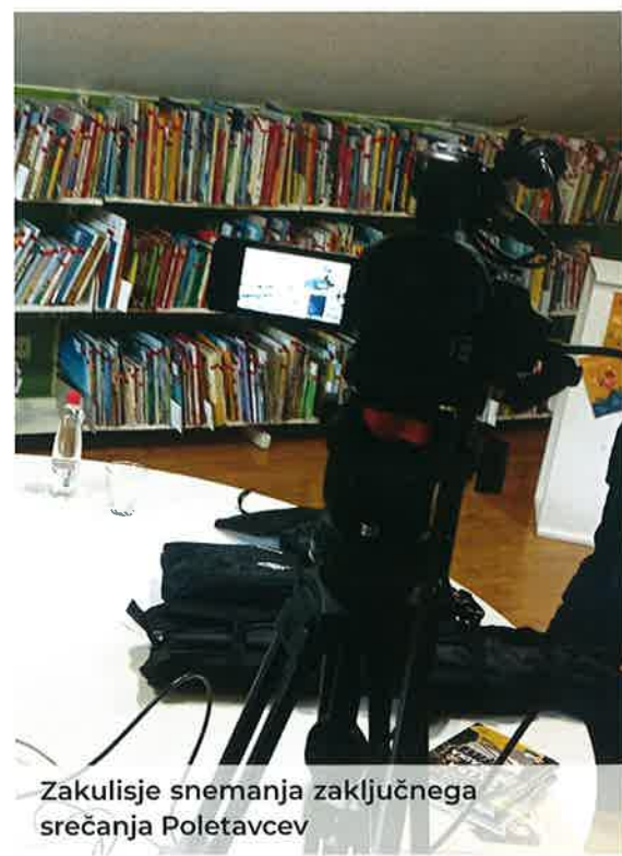
Zakulisje snemanja zaključnega srečanja Poletavcev

REPUBLIKA SLOVENIJA MINISTRSTVO ZA GOSPODARSKI RAZVOJ IN TEHNOLOGIJO