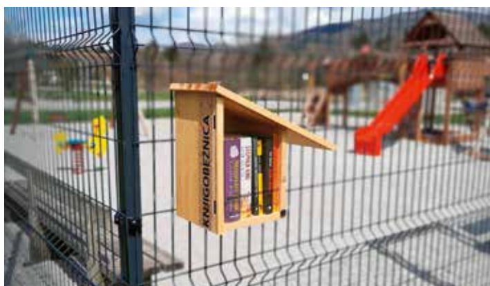
Knjigobežnica na Griču

Ljubitelji knjigobežnic se združujejo na spletu – na Facebooku deluje skupina Knjigobežnice, kjer lahko najdete zemljevid vseh knjigobežnic, namige za dobro branje in ostale književne vsebine.